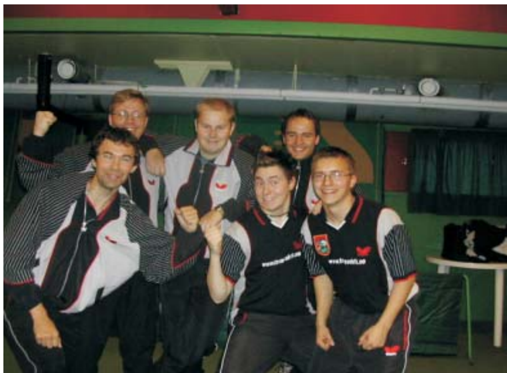
Her er 75% av Tromsø BTKs serielag

Det meste av det som er verdt å vite om TBTK finner du på